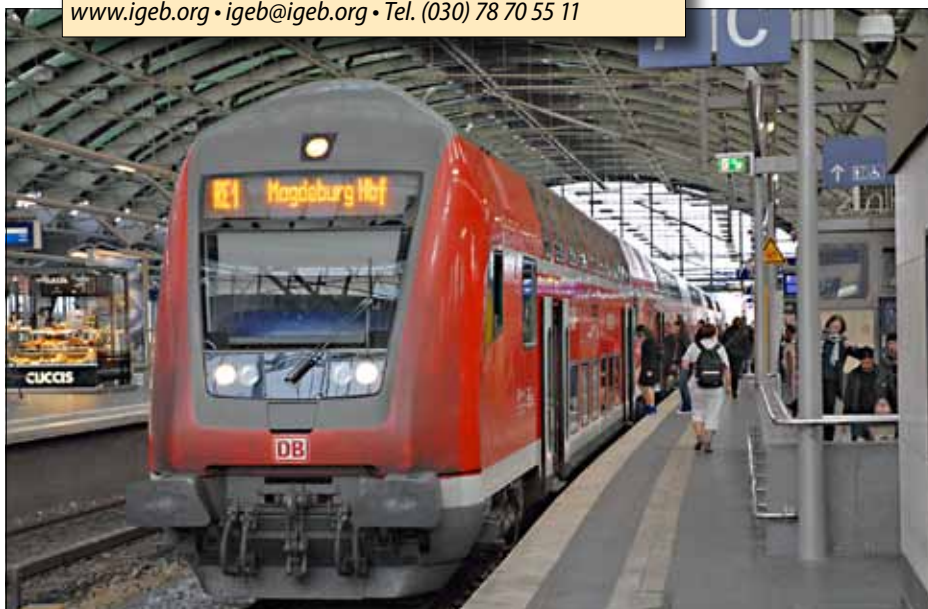
Regionalexpress von Berlin nach Magdeburg. Wer eine Fahrradkarte für das VBB-Gebiet besitzt und nach Sachsen-Anhalt reist, wo die Fahrradmitnahme im Regionalverkehr kostenlos ist, muss dennoch einen Anschlussfahrchein lösen, weil der Fahrausweis immer nur bis zur letzten Station im VBB-Tarifgebiet und nicht bis zur VBB-Tarifgebietsgrenze gilt.

Es gibt Haltestellen, wo die Tarifzuordnung nicht klar ist. Die Haltestellen „S Landsberger Allee“ und „S Prenzlauer Allee“ der Buslinie 156 sind als Beispiel zu nennen. Sie liegen außerhalb des S-Bahn-Rings (und damit geographisch in B). Auch in der Perlschnur und an den Haltestellen sind sie Zone B. Jedoch ist im BVG-Stadtplan die Grenze so um die Haltestel-