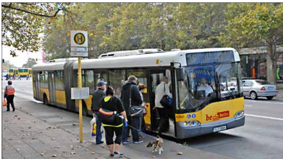
Bus 156 am S-Bf Landsberger Allee. Die Haltestelle ist als Station im Tarifbereich B gekennzeichnet. Aber im BVG-Stadtplan ist die Grenze so um die Haltestelle herum gezeichnet, als ob sie in Zone A läge.

len herum gezeichnet, als ob sie in Zone A lägen. Lügen sie in A, hätten BC-Karten-Inhaber ein Problem, diesen Bus zu nehmen. Sie müssten eine Station vorher aussteigen, zur übernächsten Haltestelle laufen und könnten erst dort weiterfahren. Die Endhaltestelle der Linie 156 und der Linie 240 „S Storkower Straße“ ist dagegen als einzige Haltestelle der Linien der Zone A zugeordnet, was nicht wirklich einen Sinn ergibt.